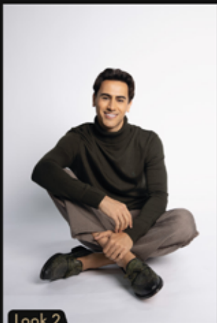
Look 2 Sweater: @john_leopard Pantalón: @nicteelfashiongt