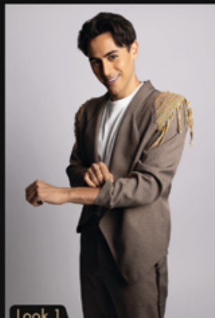
Look 1 @nicteelfashiongt