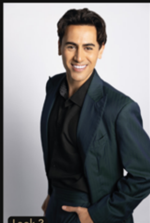
Look 3 Traje: @lanificiodilivenza